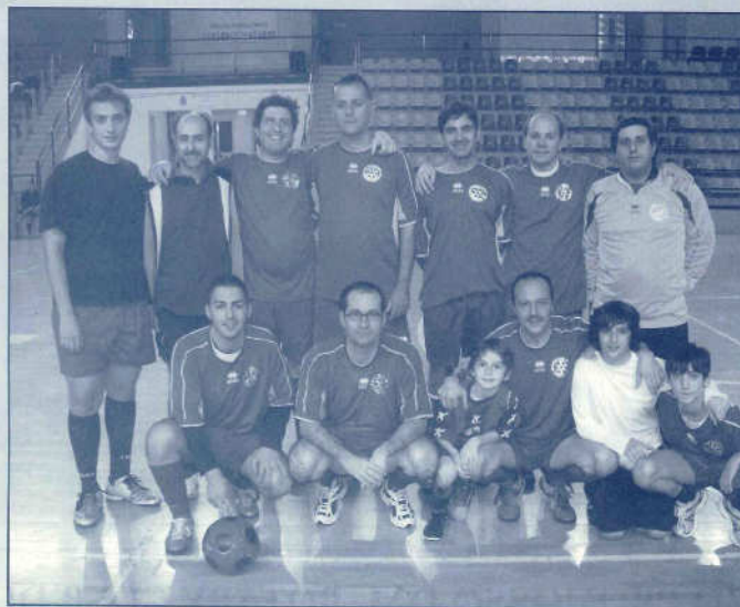
Il Dream Team del Rotary Club Acì Castello