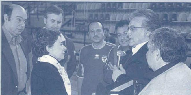
Alcuni momenti del torneo di calcetto svoltosi al Palacannizzaro.

RACCOLTA FONDI IN FAVORE DELLA ROTARY FOUNDATION - TORNEO QUADRANGOLARE DI CALCETTO FRA ROTARY CLUB ACI CASTELLO CATANIA 4 CANTI-CENTENARIO, ARTISTI, GIORNALISTI E DIRIGENTI/GIOCATORI DELLA PALLAVOLO CATANIA