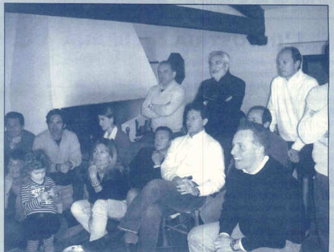
..... troppo assorti: il Catania perde!!!