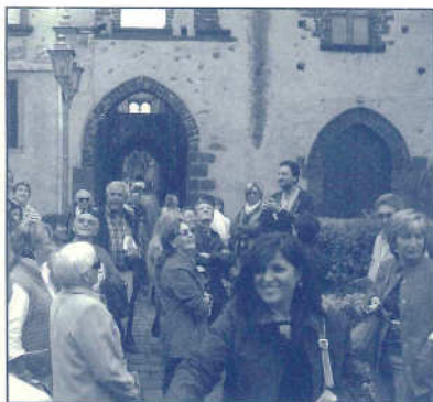
Gruppo di soci in visita a Randazzo

gradito i cannoli alla ricotta. La giornata si è conclusa con lo scambio dei giardiotti e la promessa di un altro interclub.